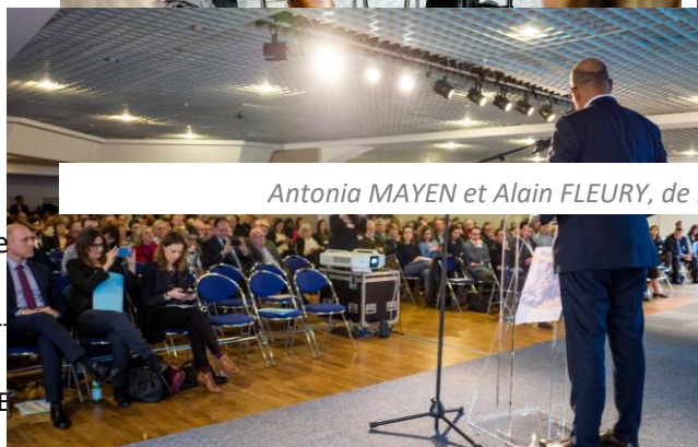
Intervention du Secrétaire d'Etat Harlem Désir.