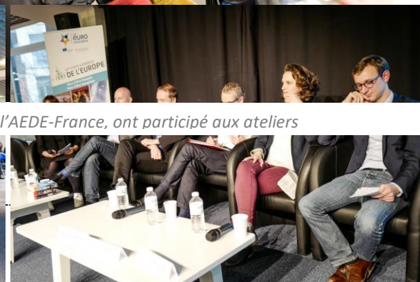
Table ronde « culturelle »